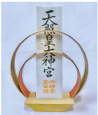
千葉県神道青年会制作